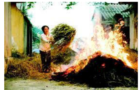
Nguồn nguyên liệu sinh khối từ phế phẩm trong sản xuất nông nghiệp đang bị bỏ phí

Việc sản xuất ethanol từ sinh khối có giá thành thấp (ví dụ như ngô, củ cải đường, mía, cỏ switchgrass và/hoặc giấy) ngày càng trở nên quan trọng trong việc tạo ra ethanol có tính cạnh tranh với xăng.