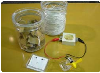
Chuẩn bị nguyên, vật liệu