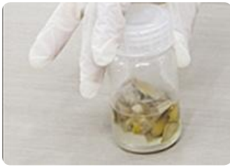
Cho giấy vào hỗn hợp enzym và nước