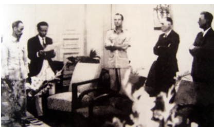
Thủ trưởng Bộ Nội vụ Hoàng Minh Giám đọc lại lần cuối bản Hiệp định Sơ bộ 6/3/1946, trước khi Bác và Sainteny ký.

Theo Hiệp ước Pháp Hoa ký ngày 28/02/1946, Trung Hoa thừa nhận chủ quyền của Pháp ở Đông Dương. Đổi lại, Pháp bỏ tô giới ở Thượng Hải, Hán Khẩu, Quảng Đông, bán lại đường xe lửa Vân Nam, và sửa đổi quy chế người Hoa ở Đông Dương. Với hiệp ước này, quân Pháp vào miền Bắc nước ta qua cảng Hải Phòng, thay thế quân Quốc