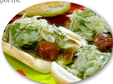
Xúc xích và bắp cải