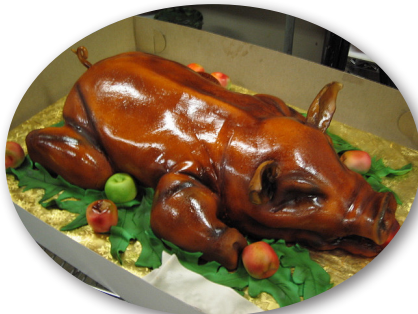
Heo sữa quay

Heo quan niệm của nhiều quốc gia, thường thức món ăn từ thịt heo giúp bạn gặp điềm lành, sự thành đạt trong cuộc sống. Con heo mập tròn mỡ màng tượng trưng cho sự thịnh vượng và sung túc; heo ủ ủ đất, thúc mình về phía trước để tìm thức ăn tượng trưng cho sự tiến tới trong cuộc sống. Món heo cho ngày đầu năm mới được các đầu bếp tài hoa khắp nơi trên thế giới chế biến theo nhiều hương vị khác nhau như heo sữa quay (tại Ireland, Cuba, Áo), thịt lợn nướng, xúc xích và bắp cải (Đức), giăm bông và rau cải xoăn (Hoa Kỳ), chân giò heo (Thụy Điển). Cho dù bạn chỉ định đến thử mỗi nơi một miếng thì bạn cũng đã phải chu du khắp thế giới rồi.