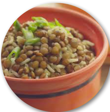
Cơm nấu với đậu lăng

Cũng như hầu hết các loại thực phẩm có hình tròn viên mãn, hạt đậu thường tượng trưng cho tiền bạc và sự thịnh vượng. Tùy thuộc vào chủng loại đậu có tại địa phương, món đậu trên bàn ăn mỗi nơi cũng khác. Người Ý ăn xúc xích thịt lợn và hạt đậu lăng xanh, người Brazil ăn cơm nấu với đậu lăng, người Nhật ăn kuro-mame, một loại đậu đen ngọt, người Mỹ thường ăn salad đậu mắt đen cùng với cà chua thái nhỏ, ớt xanh, và rau mùi trong các bữa ăn đầu năm mới. Ngày xuân ăn một bát cơm nấu đậu không thôi cũng đã là món quà đầy may mắn cho thượng khách ở nhiều quốc gia.