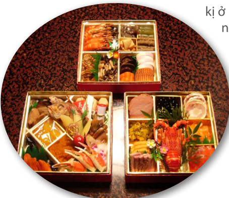
Món ăn trong năm mới thường được bảo quản trong những chiếc hộp sơn màu đỏ...