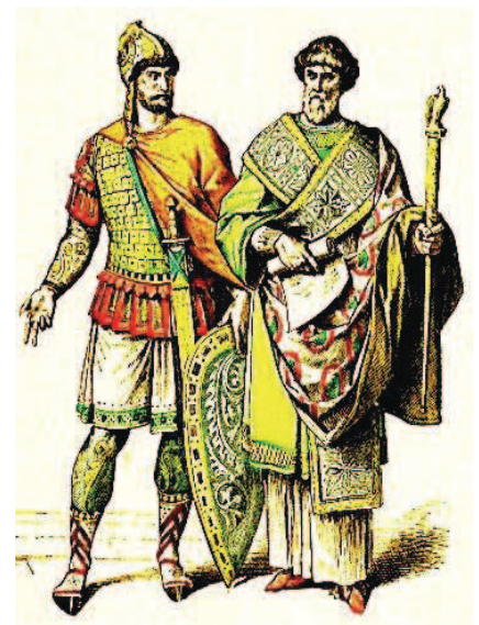
Trang phục binh lính La Mã cổ đại