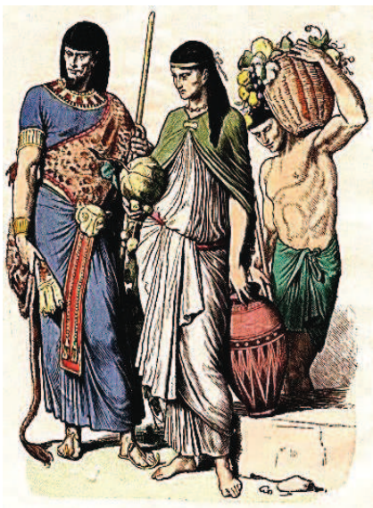
Trang phục quân, thân Ai Cập cổ đại

Có rất nhiều tranh cãi về nguồn gốc ra đời của chiếc cà vạt. Theo các nhà sử học, cà vạt xuất hiện sớm nhất tại Ai Cập, vì dải lụa trước ngực thể hiện địa vị xã hội của quý ông xứ kim tự tháp