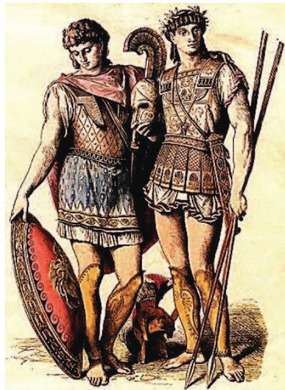
Trang phục lính và người thân Hy Lạp cổ