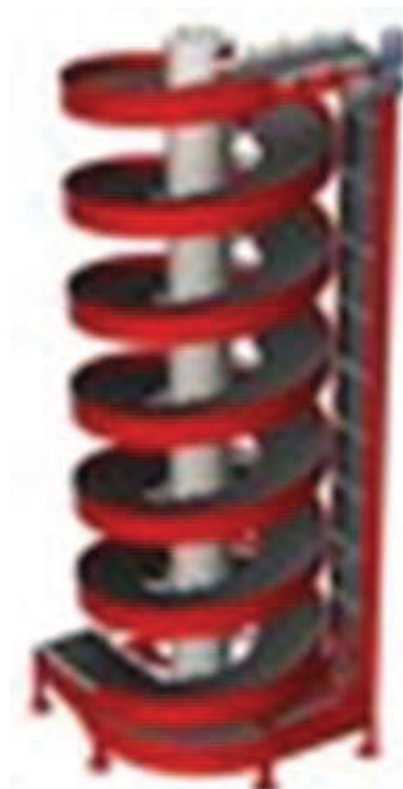
Băng tải hàng dạng xoắn