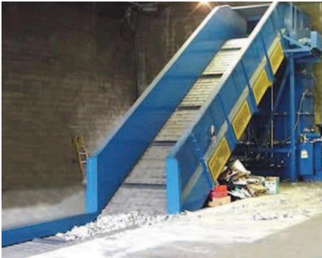
Hệ thống băng tải nghiêng thiết kế cho Cty TNHH SX-TM giấy Thiên Trí (Tp.HCM) giúp giảm diện tích mặt bằng và tăng hiệu suất sản xuất.