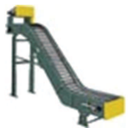
Băng tải chữ Z kiểu xích tằm