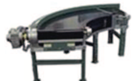
Băng tải cong PVC 90 độ